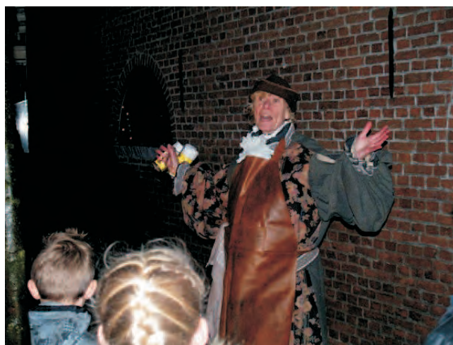
Dominee als de herbergier

Op weg naar het volgende stuk verhaal kwamen we bij de herberg. Die zat natuurlijk vol. De herbergier had het druk en stuurde ons richting de Haven. Bij de Haven waren de herders. Zij hadden het kindje Jezus gezien!