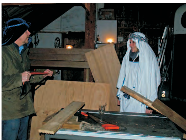
Rimmer als Jozef en Jetty als de engel Gabriël

Op vrijdagavond voor de kerstvakantie brandden er veel lichtjes in Rottevalle. Op de route van de kuier stond voor elk raam een kaarsje. Een van de kleine dingen die de kuier tot een groot succes maakten. De eerste stop bracht ons bij Jozef, druk aan het timmeren voor de inrichting van zijn nieuwe huis die hij samen met Maria zou betrekken. Ook de engel kwam bij Jozef op bezoek en bracht met haar mee geweldig nieuws. Maria was zwanger!