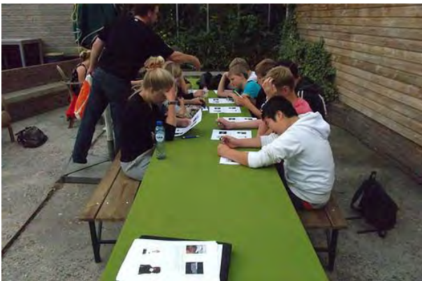
De Ferbining september